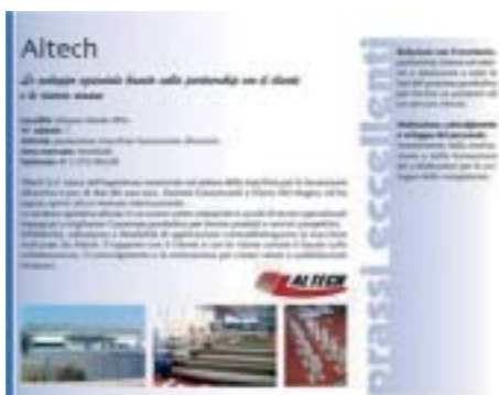
ESEMPIO DI PRESENTAZIONE DI UNA IMPRESA ECCELLENTE

Nell'ambito dei sistemi di PMI, rivestono un ruolo fondamentale le imprese capaci di fungere da modello per l'intera comunità, in virtù del possesso di modi di operare efficaci alla base dei successi aziendali, sintetizzabili in buone pratiche esemplari ed adattabili ad altri contesti. Il valore dell'azienda detentrici di best practice risiede nel suo ruolo di centro motore della produzione di conoscenze e nel suo possibile uso in qualità di sede di apprendimento ed a supporto di politiche di sviluppo locale e settoriale.